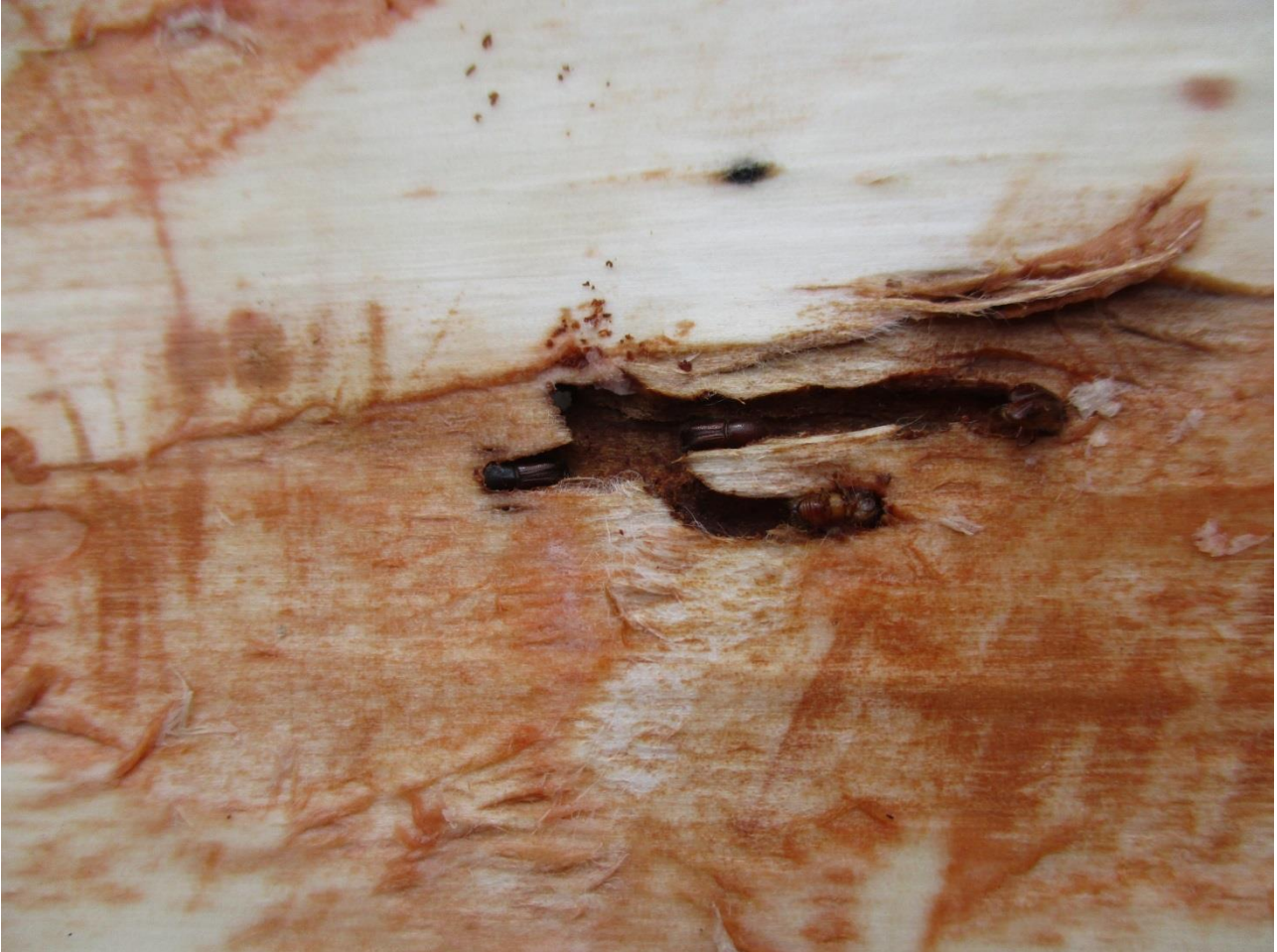
Abb. 4: Rammelkammer, entstehende Muttergänge, Blick in eine künftige Freiburger Borkenkäfer-Kita am heutigen 9. April 2018

An die Betreuerinnen und –betreuer der Fallen im Pufferstreifen: Wie vereinbart ab morgen (10.4.2018) die Fallen mit Pheroprax beködern und immer dienstags leeren und die Zahlen an uns übermitteln. Auf allen Geräten (alt und neu) ist die ODK-App installiert. Sollte es zu Problemen bei der App-Bedienung kommen, dann melden Sie sich einfach.